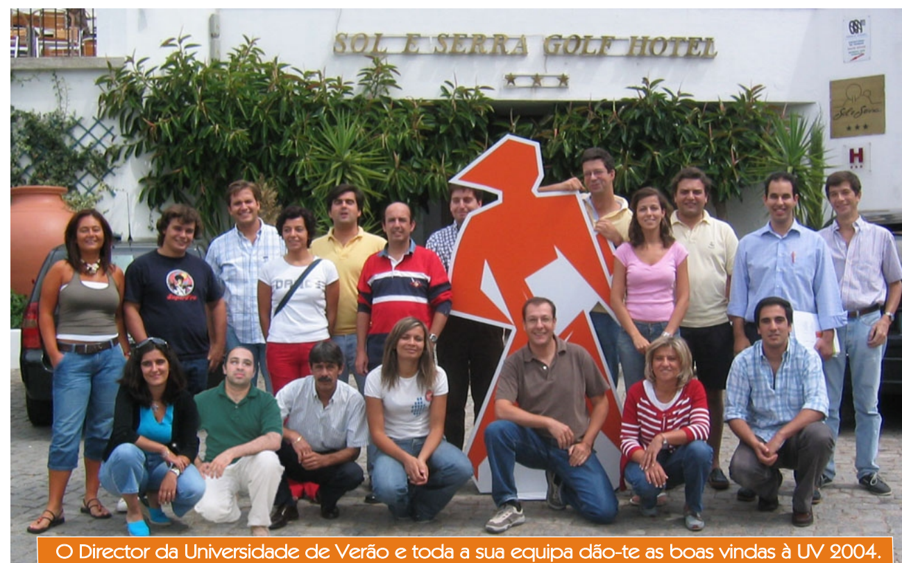
O Director da Universidade de Verão e toda a sua equipa dão-te as boas vindas à UV 2004.